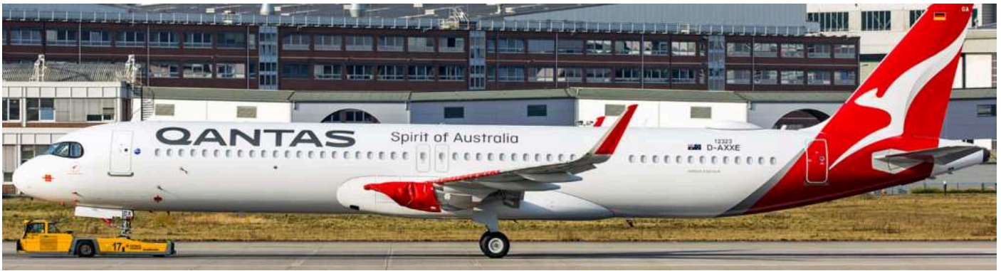
Am 15. Februar hatte der erste A321 Neo für Qantas roll-out in vollen Farben in Finkenwerder (D-AXXE)