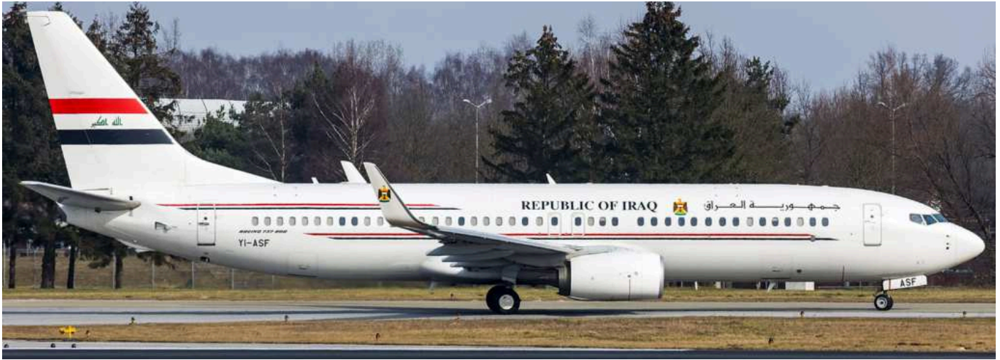
Am 5. März traf in Hamburg die Iraq Gvmt B737-800 YI-ASF zur Wartung bei Lufthansa-Technik ein