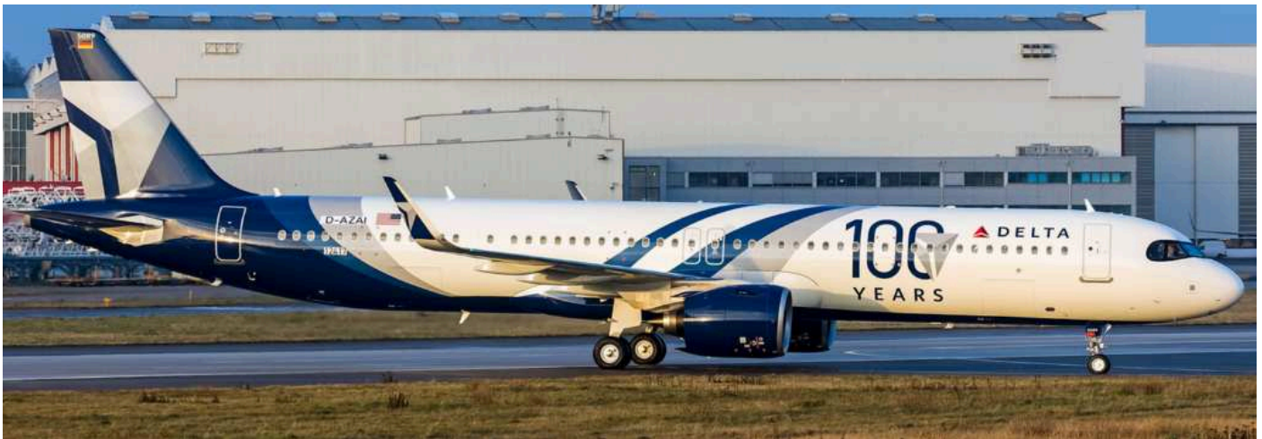
Delta hat einen A321 Neo (D-AZAI) und einen A350-900 in „100 years“ Lackierung erhalten